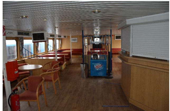
Abb.: Unterer Salon