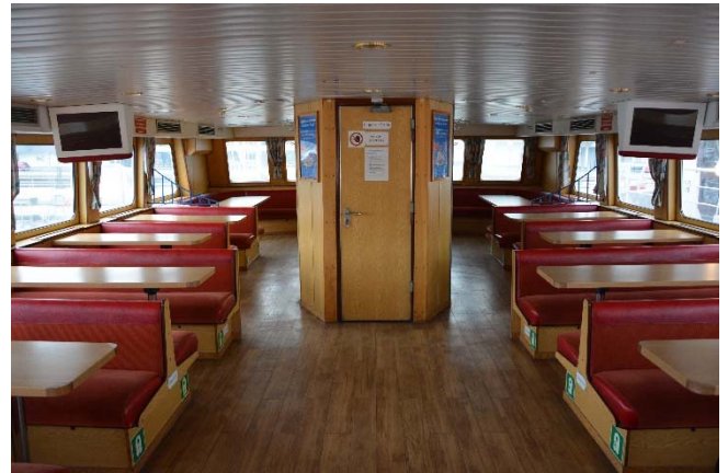
Abb.: Oberer Salon

Bei Interesse, das Fahrgastschiff „Laboe“ zu besichtigen, wenden Sie sich bitte per Mail oder postalisch an die Betriebsleitung der Schlepp- und Fährgesellschaft Kiel mbH – SFK unter nachfolgend aufgeführte Adressen: michael.maibom@sfk-Kiel.de oder Schlepp- und Fährgesellschaft Kiel mbH, Kaistraße 51, 24114 Kiel.